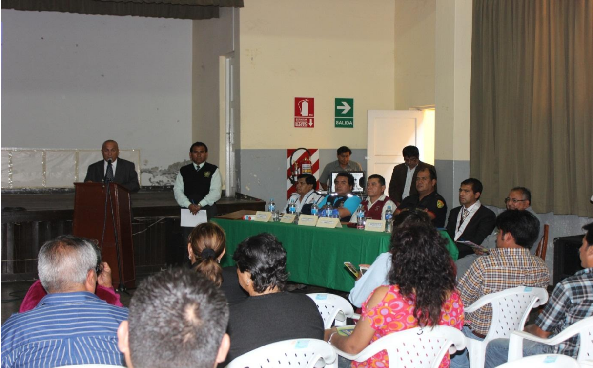
Inauguración del Foro Distrital “Seguridad Ciudadana y Desarrollo”, realizado los días 20 y 21 de Noviembre del 2012

El Foro Distrital de “Seguridad y Desarrollo”, fue inaugurado por el Alcalde, participaron todos los miembros del Comité Distrital de Seguridad Ciudadana, además de aproximadamente entre 150 ciudadanos, entre profesionales, dirigentes de las Juntas Vecinales, organizaciones sociales de base, Alcalde de los Centros Poblados, Tenientes Gobernadores, etc.