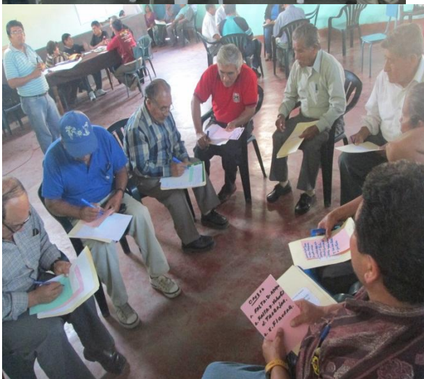
Fotos de los talleres realizados en los Centros Poblados de Casa Grande y Roma

Una vez recogido las necesidades y problemas de los ciudadanos, se sistematizo y elaboro el primer borrador del Plan Operativo de Seguridad Ciudadana; este primer documento, se presentó en la reunión del Comité Distrital de Seguridad Ciudadana, siendo aprobado unánimemente y a la vez, en dicha reunión se aprobó la convocatoria al