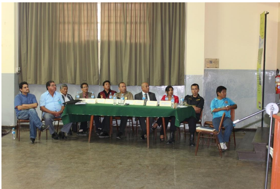
Integrantes del Comité Distrital de Seguridad Ciudadana – Casa Grande.

Primero, fue la renovación del Comité Distrital de Seguridad Ciudadana donde se incorporaron a diferentes actores y representantes de las instituciones públicas y privadas, así como también representantes de la sociedad civil; este Comité Distrital lo preside el Alcalde del Distrito, además lo integran: 1) el Comisario de la Policía Nacional de Perú en el distrito, 2) El Gobernador Distrital, 3) el Jefe del Establecimiento de Salud, 4) el Director de la Institución Educativa “Casa Grande”, 5) la Juez de Paz de Primera Nominación, 6) el párroco de la Iglesia Católica, 7) el representante de la asociación de Jubilados del Centro Poblado de Roma, 8) el Alcalde del Centro Poblado de Roma, 9) el representante de la Asociación de Comerciantes del Distrito, 10) el presidente de la Cámara de Comercio del Distrito, 11) el presidente de la Junta Vecinal del 8 de Setiembre, 12) el representante de la Asociación de periodistas del Distrito. Es importante indicar que el Comité Distrital de Seguridad Ciudadana, se reúne mensualmente para evaluar las acciones y actividades que se vienen realizando, así como también programar las respectivas acciones que se programan para los siguientes treinta días; todas estas acciones están dentro del marco de las actividades programadas para el presente año, que viene a ser el Plan Operativo de Seguridad Ciudadana.